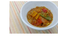
(改)ソーセージと野菜のカレー煮込み