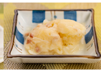
(改)じゃが芋のクリーム煮