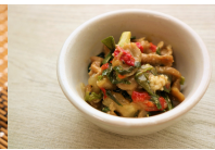
(改)ニラと豚肉の味噌炒め