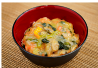
(改)あさりの中華丼の具