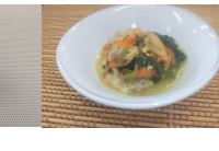
(改)あさりとほうれん草の玉子とじ