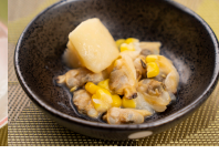
(改)あさりとじゃが芋のクリーム煮