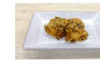
(改)真あじのしそ巻き天ぷらおろしポン酢