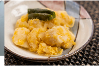
(改)豆腐のチャンプルー