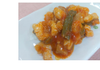
(改)豚肉と白いんげん豆のトマト煮