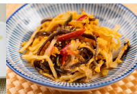
(改)筍と玉子の中華風炒め