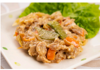
(改)豚肉と野菜のオイスター炒め