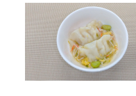
(改)水餃子のカニ風あんかけ