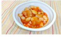
(改)野菜入りトマトビーンズ