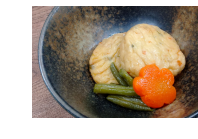
(改)飛龍頭の含め煮