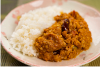
(改)3色豆入りトマトキーマカレー