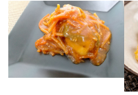
(改)タラの中華風味噌ダレ