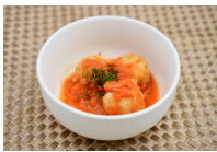
(改)鶏団子のトマトクリーム煮込み