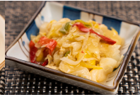
(改)野菜の柚子胡椒炒め