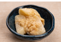
(改)里芋のそぼろあんかけ