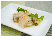
(改)タラと野菜のクリーム風味