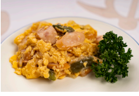
(改)ウインナーと玉子の炒め物