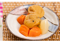
(改)がんもの含め煮