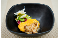
(改)野菜のたまごせきのこ醤油あんかけ