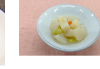
(改)イカと大根の炒め煮