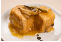
(改)厚揚げの醤油あんかけ