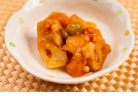
(改)根菜のカボナータ風