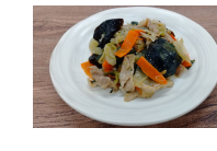
(改)豚肉とチンゲン菜の豆鼓炒め