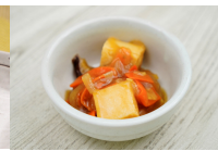
(改)厚揚げの五目あんかけ