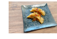
(改)水餃子の香味ダレ