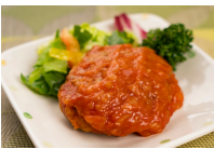
(改)ハンバーグトマトソース