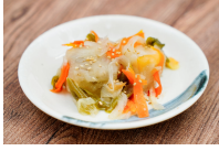
(改)アジと野菜の南蛮風