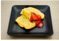
(改)スペイン風オムレツ