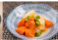
(改)はんぺんと野菜の田舎煮