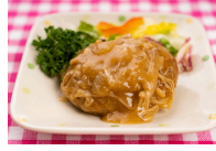
(改)ハンバーグ和風きのこソース