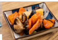
(改)じゃが芋と椎茸の煮物