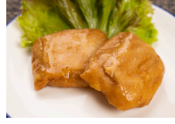
(改)チキンステーキ照焼ソース