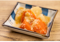
(改)大根と人参のそぼろ煮