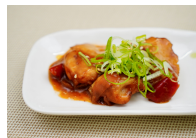
(改)鶏肉の黒酢炒め