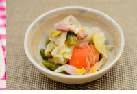
(改)洋風けんちん煮