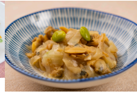
(改)あさりと玉葱のんにく醤油