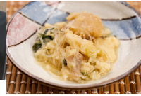
(改)豆腐と春雨の旨煮