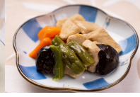
(改)高野豆腐のがめ煮