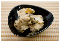
(改)真鯛入りつみれの胡麻柚子あん