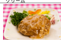
(改)ハンバーグ和風きのこソース