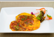
(改)イタリアンオムレツ