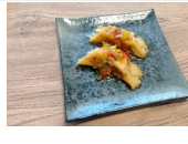
(改)水餃子の香味ダレ