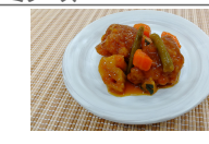
(改)唐揚げと野菜の黒酢あん