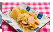
(改)ソーセージのポトフ風