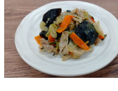
(改)豚肉とチンゲン菜の豆鼓炒め