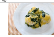
(改)真鯛入りつみれの玉子あんかけ