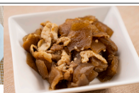
(改)豚肉とこんにゃく炒め