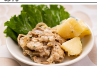
(改)牛肉とポテトのガリバターソース