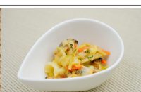
(改)あさりと野菜の炒め煮