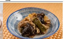
(改)牛肉入り野菜の甘辛煮