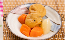
(改)がんもの含め煮