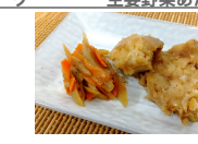
(改)白身魚の蒲焼き風