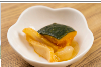
(改)南瓜のほっこり煮