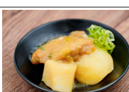
(改)チキンとポテトの味噌だれ