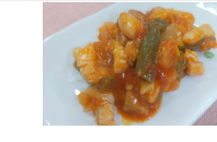
(改)豚肉と白いんげん豆のトマト煮