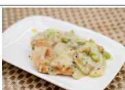
(改)鶏肉ときのこのレモンクリーム