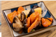
(改)じゃが芋と椎茸の煮物