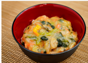
(改)あさりの中華丼の具