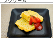
(改)スペイン風オムレツ