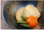
(改)飛龍頭の含め煮