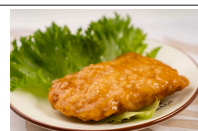
(改)チキン竜田 甘酢ソース