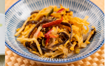
(改)筍と玉子の中華風炒め