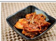
(改)中華風鶏きんぴら