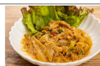
(改)牛蒡と牛肉のカレークリーム