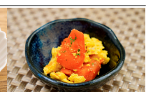
(改)人参と玉子の炊き合わせ