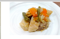
(改)鉄チャンプルー