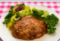
(改)ハンバーグきのこデミソース