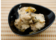
(改)真鯛入りつみれの胡麻柚子あん