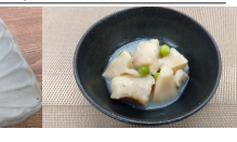
(改)筍と鶏肉のクリーム煮