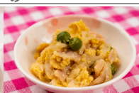
(改)ハムと玉葱の玉子とじ