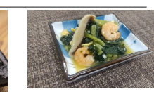
(改)海老の和風玉子とじ