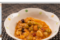
(改)ポークビーンズ