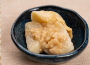
(改)里芋のそぼろあんかけ