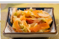
(改)カレー風味ソテー