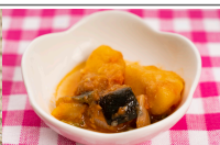
(改)茄子とオクラのトマトソース煮