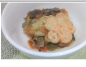
(改)しんじょと野菜の旨煮