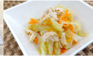
(改)キャベツと鶏肉の華風炒め