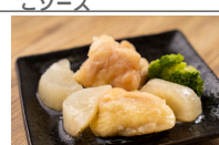
(改)大根と鶏肉の旨煮