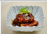
(改)鶏ごぼう巻き照焼