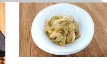
(改)蒸し鶏と茄子の味噌和え