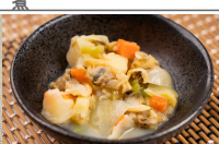
(改)あさりとキャベツのクリームシチュー風