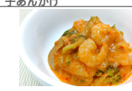
(改)海老とブロッコリーのトマトクリーム