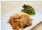
(改)豆腐と魚のハンバーグ 生姜野菜あん