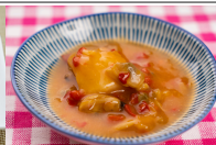
(改)あさりとじゃが芋のピリ辛醤油仕立て