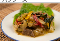
(改)牛肉と小松菜の炒め物