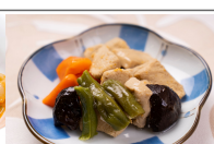
(改)高野豆腐のがめ煮