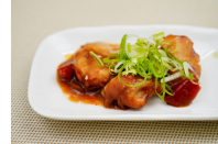
(改)鶏肉の黒酢炒め