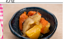
(改)さつま芋の煮しめ