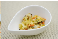
あさりと野菜の炒め煮