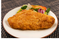
ささみチーズフライ