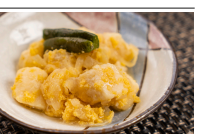
豆腐のチャンプルー