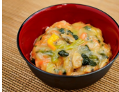
あさりの中華丼の具