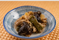
牛肉入り野菜の甘辛煮