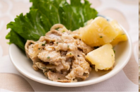
牛肉とポテトのガリポテトソース