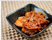
中華風鶏さきんばら