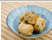
鶏団子のみぞれ煮