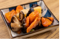
じゃが芋と椎茸の煮物