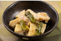
筍と鶏肉のクリーム煮