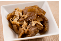
豚肉とこんにゃく炒め