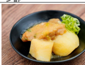
チキンとポテトの味噌だれ