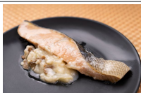
鮭のクリームソース