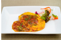
イタリアンオムレツ