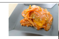
タラの中華風味噌ダレ