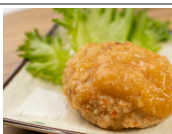
豆腐ハンバーグおろしポテト酢