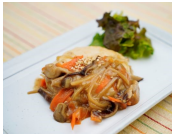
豆腐と魚のハンバーグ生姜野菜あん