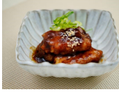
鶏ごぼう巻き照焼