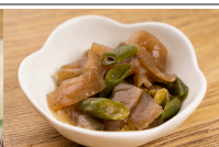
茄子とこんにゃくの煮浸し