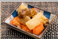
野菜のごま味噌煮