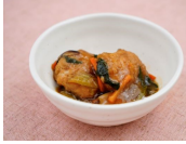
里芋団子と野菜の旨煮