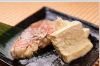
赤魚と豆腐のあごだし煮