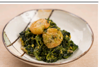
海老の和風玉子とじ