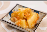
じゃが芋のそぼろあんかけ