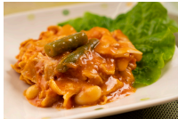
豚肉と白いんげん豆のトマト煮