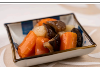
大根と椎茸の煮物