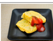
スペイン風オムレツ