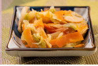
カレー風味ソテー