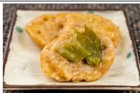
豚肉の蓮根はさみ生姜あん