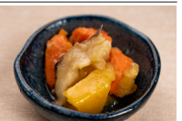
さつまいも煮しめ