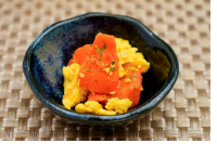
人参と玉子の炊き合わせ