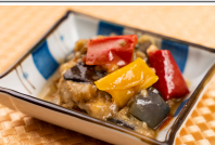
ナスとベーコンの塩炒め