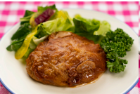
ハンバーグきのこデミソース