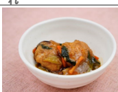
里芋団子と野菜の旨煮