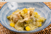
野菜のバジル炒め