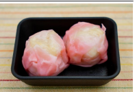
竹の子しゅうまい