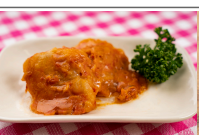
カレーのトマトクリーム