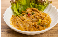
牛蒡と牛肉のカレークリーム