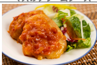
チキンステーキトマトソース