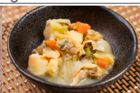
あさりとキャベツのクリームシチュー風