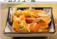
カレー風味ソテー