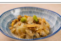
あさりと玉葱のんにく醤油