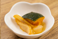
南瓜のぼっこり煮