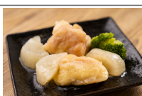
大根と鶏肉の旨煮