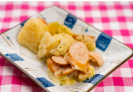
ソーセージのポトフ風